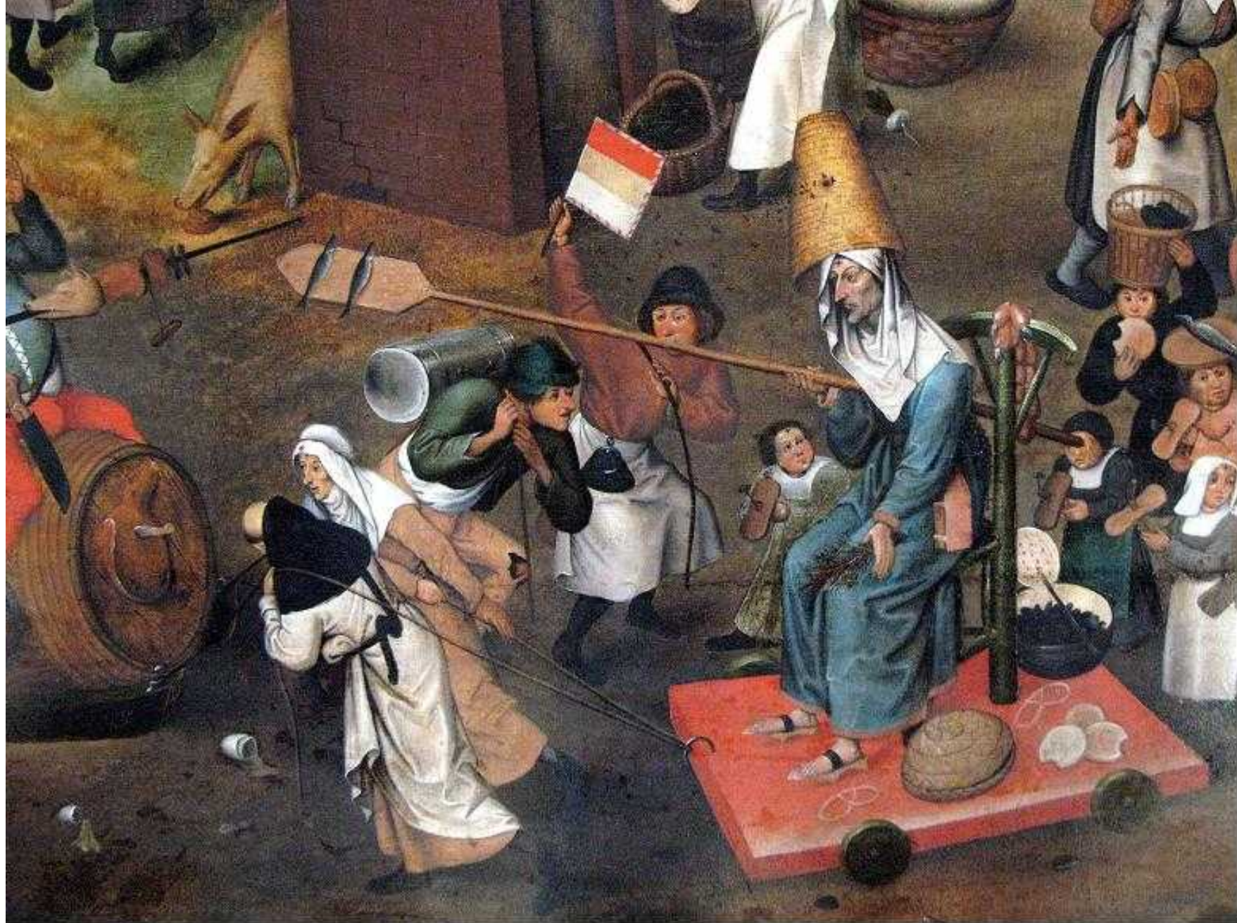
Mise en place des Chaires d'Excellence