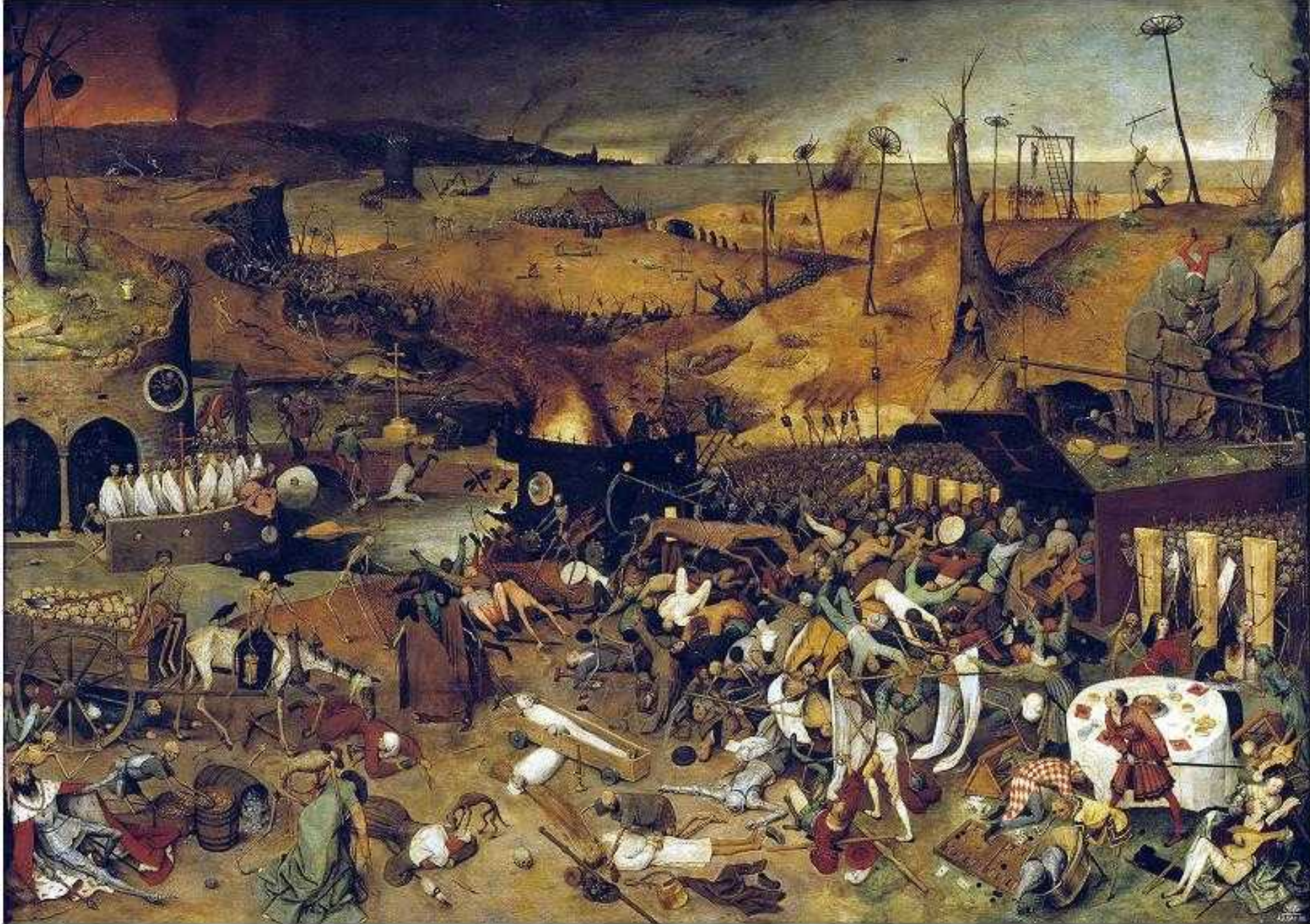
Le nouveau paysage de la recherche